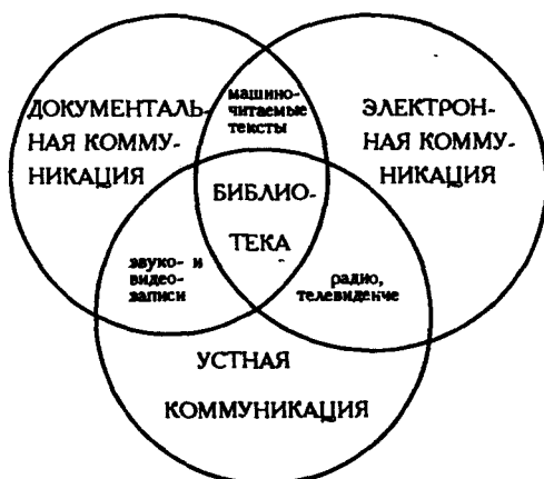
Рис. 2.1. Библиотека в системе коммуникационных каналов и средств

Все три рода взаимодействуют друг с другом, образуя смешанные, гибридные коммуникационные каналы и средства, например, радио и телевидение, звуко- и видеозапись, машинно-читаемые текстовые документы. Если наглядно изобразить соотношение между разными родами коммуникаций, оказывается, что библиотеке как коммуникационному центру принадлежит центральная область пересечения всех трех родов (рис. 2.1).