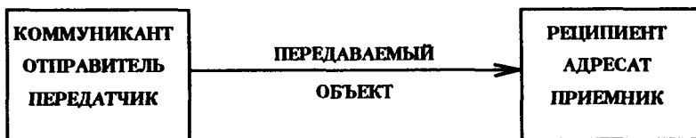
Рис. 1.1. Элементарная схема коммуникации

Начнем, как говорили древние, "ab ovo", т. е. с элементарной схемы коммуникации, принимаемой всеми известными дефинициями и концепциями (рис. 1.1).