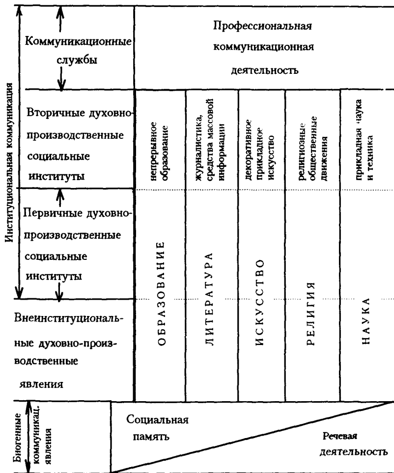
Рис. 1.5. Пирамида социально-коммуникативных явлений