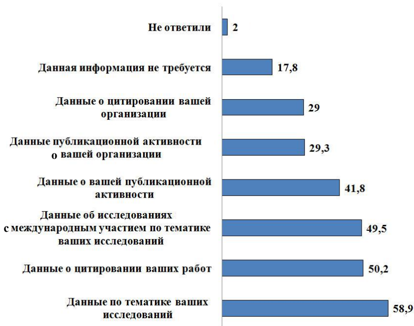
Рис. 2. Распределение потребностей ученых ПНЦ РАН в различных видах библиометрической информации (%)

Подобный интерес со стороны научного сообщества и администраций институтов способствовал тому, что в анализ были включены БД, разрабатывающие наукометрические показатели.