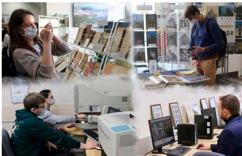
Рис. 3. Читатели в ГПНТБ России. 2021 г.

по инициативе Министерства образования и науки Российской Федерации, стал электронный каталог библиотек сферы образования и науки «ЭКБСОН» (на сегодня в нём 63,2 млн записей), который ежегодно пополняется и позволяет найти учебные и научные издания в фондах более чем 320 университетских и вузовских библиотек, расположенных во всех уголках страны. Широко известны полнотекстовые ресурсы других систем: Научного архива ГПНТБ России (2,7 млн документов) и Электронной научной библиотеки ГПНТБ России (31,6 тыс. документов). В последние годы создан научно-образовательный видеоархив, включающий более 300 видеозаписей семинаров, вебинаров, круглых столов, докладов конференций и выступлений специалистов. Он может использоваться как образовательный ресурс и материал для научно-методической деятельности.