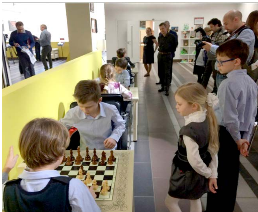
Рис. 4. Школьники в Центре шахматной культуры и информации

ГПНТБ России, начиная с 2008 г., осуществляет дополнительное профессиональное образование (ДПО) в соответствии с лицензией на осуществление образовательной деятельности Департамента образования города Москвы (лицензия № 037788). Образовательная сфера деятельности библиотеки включает в себя не только ДПО с выдачей документа о повышении квалификации после прохождения занятий, но и другие мероприятия, которые способствуют получению новых знаний и навыков. Все направления деятельности объединены в комплекс, предназначенный как для специалистов библиотечно-информационной сферы, так и для читателей, педагогов, учеников, студентов различных образовательных учреждений и организаций, родителей и др. [11].