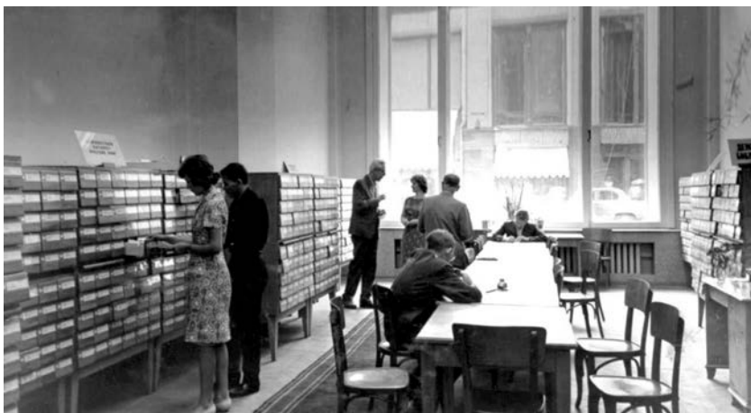
Рис. 2. Работа с карточными каталогами в ГПНТБ СССР в 1964 г.

В 1967 г. ГПНТБ СССР получает статус научно-исследовательского учреждения. В соответствии с ним она может проводить научные исследования и разработку традиционных и автоматизированных процессов с целью повышения эффективности библиотечно-информационного обслуживания в ГПНТБ СССР и сети научно-технических библиотек.