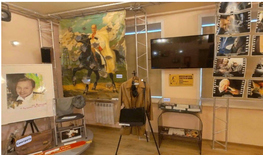
Рис. 9. Виртуальный музей актёра Андрея Панина

изображений и эффектом полного присутствия). Примером VR-проекта, реализованного КемГИК, является виртуальный музей актёра Андрея Панина (рис. 9).