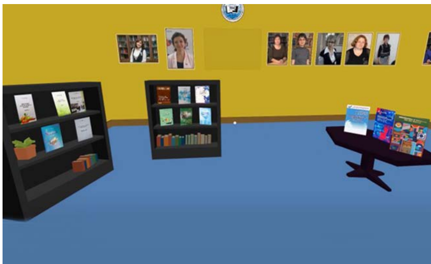
Рис. 4. Виртуальная выставка преподавателей кафедры технологии документальных и медиакоммуникаций

Студенты режиссёрско-педагогического факультета используют VR-оборудование для просмотра театрализованных представлений. Например, трёхмерная панорамная запись реального представления и её преобразование в VR-проект позволит зрителю увидеть спектакль в шлеме VR, не посещая театр. При этом создаётся иллюзия реального присутствия не только в зрительном зале, но и на сцене рядом с актёрами. Возможности анимации трёхмерных изображений позволяют добиться реалистичности визуализируемого пространства. Изучение и анализ спектакля в VR более эффективны, чем по видеозаписи.