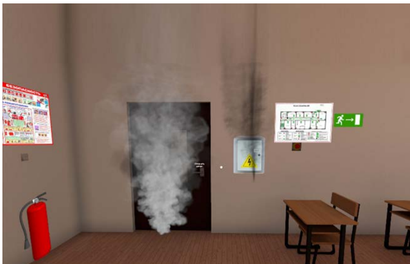
Рис. 8. VR-тренажёр по технике пожарной безопасности

для студентов факультета социально-культурных технологий. В качестве примера можно назвать обучающий тренажёр, моделирующий действия при пожаре в учебном заведении (рис. 8).