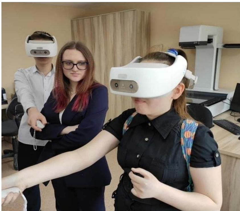
Рис. 3. Студенты КемГИК на практических занятиях по дисциплине «VR-технологии»

Интересным примером возможностей VR в библиотеке является организация интерактивных библиотечных выставок (например, VR-выставка «Публикации преподавателей кафедры технологии документальных и медиакоммуникаций КемГИК») (рис. 4).