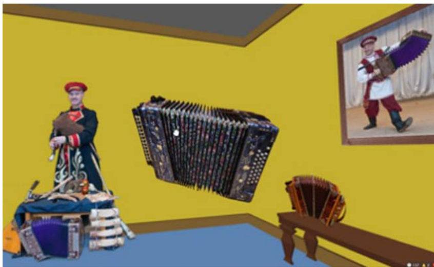
Рис. 6. Виртуальная выставка музыкальных инструментов с аудиосопровождением

участником экскурсии. Виртуальная среда позволяет показать не только реальное состояние предмета экспонирования, но и то, как он выглядел в прошлом или изменится после реставрации. Основными видами информации о предметах экспонирования можно назвать развёрнутые фактографические сведения об экспонатах, их истории, особенностях, размере, материале, возрасте; имена авторов, владельцев и др. В качестве справочной информации об экспозиции предоставляются сведения об историческом периоде экспозиции, истории коллекции, персоналиях и т. д.