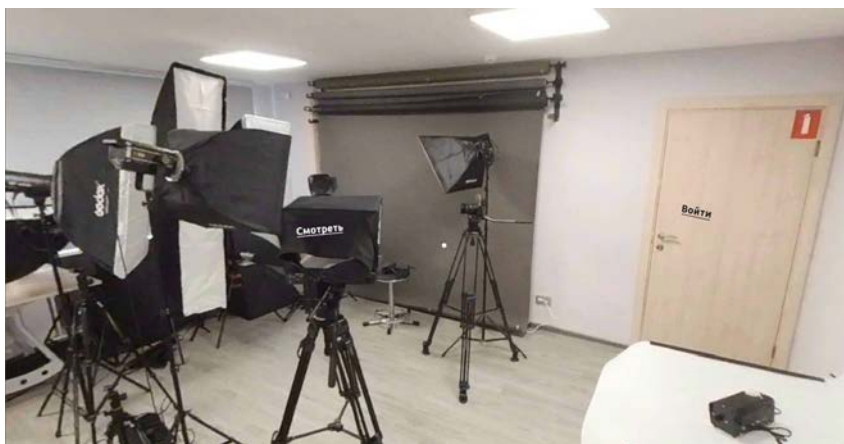
Рис. 10. Виртуальная экскурсия по Центру прототипирования цифрового контента

VR-проекты актуальны и в профориентационной деятельности. Представленные примеры демонстрируются абитуриентам с помощью VR-шлемов во время различных профориентационных мероприятий. Перспективным направлением может стать разработка виртуальных приложений, обучающих основам профессии. Например, в Норвежском университете естественных и технических наук разработана программа «Виртуальная стажировка» Immersive Job Taste, которая позволяет «провести» рабочий день и выполнить типичные задачи рыбака, электрика ветряной турбины, дорожного рабочего, автомеханика, сварщика. Также разработано VR-приложение, моделирующее собеседование при приёме на работу, где в виртуальном офисном помещении участник отвечает на вопросы, появляющиеся в зависимости от выбранных им вариантов ответов [9, 10].