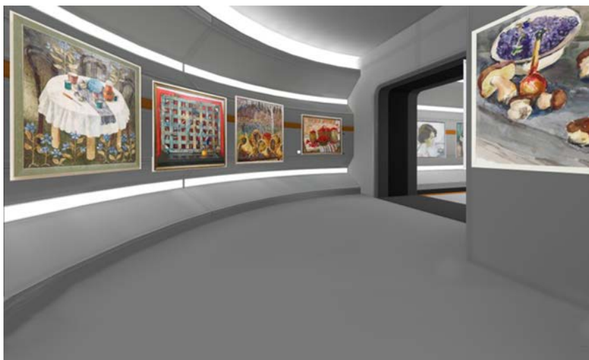
Рис. 7. Художественная VR-коллекция КемГИК

Выставка представляет собой виртуальные тематические залы, в которых размещены картины из художественной коллекции КемГИК. При наведении указателя контроллера на картину отображается основная информация (название, имя художника, материал, дата создания и т. д.). В каждом зале размещена текстовая информация о представленных экспонатах, а также интерактивная панель с именами художников, при нажатии на которую демонстрируется краткая биографическая справка.