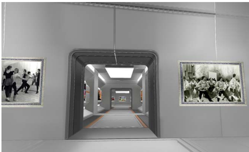
Рис. 5. Виртуальная выставка ансамбля народного танца «Молодой Кузбасс»

Примером использования VR-технологий на факультете музыкального искусства является «Виртуальная выставка народных музыкальных инструментов творческих коллективов КемГИК», посвящённая профессору А. В. Соловьёву (рис. 6).