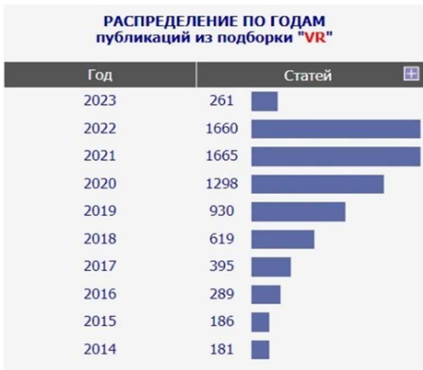
Рис. 1. Распределение публикаций по теме

Отметим, что общим вопросам технологии VR (терминология, правовые аспекты, специфика и т. д.) посвящено 22,5% выявленных публикаций, философским и психологическим аспектам воздействия VR на человека – 18,3%, применению VR-технологий в медицине – 9,4%, в промышленности, сельском хозяйстве и других технических сферах – 9,9%, в бизнесе, маркетинге и рекламе – 2,6%, в информационных технологиях, программировании и разработке игр – 3,1%, в сфере культуры и искусства – 4,7%.