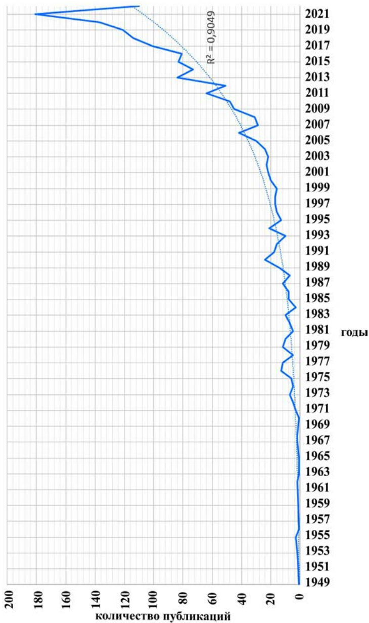
Рис. 1. Динамика публикационной продуктивности работ по проблемам моральных дилемм и морального выбора с 1949 по 2022 г. (на материале библиометрической системы Scopus)