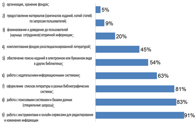
Рис. 3. Компетенции, необходимые для сотрудников академических библиотек