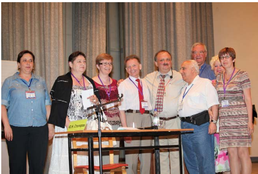
Фото 6. Участники, секунданты, дуэлянты и эксперты дуэли