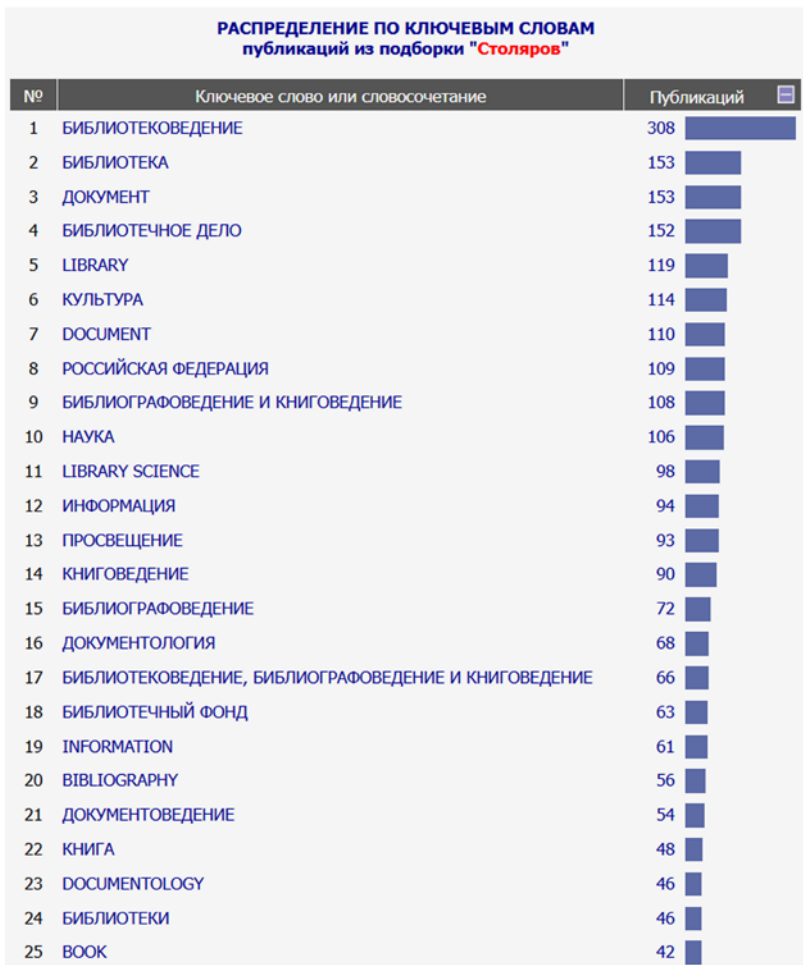
Рис. 2. Скриншот статистического отчёта распределения цитирующих труды Ю. Н. Столярова публикаций по ключевым словам (по данным РИНЦ)