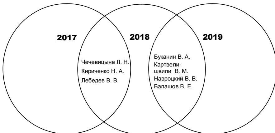
Рис. 2. Авторы из топ-30 запросов в 2017–2019 гг.

На следующем этапе библиометрического анализа была выдвинута гипотеза: запросы к ЭК от поисковых машин интернета связаны с наличием полных текстов «топовых» авторов и возможностью их скачивания пользователями. Рассмотрим, какие издания авторов представлены в ЭК ГПНТБ России, и выявим наличие их полных текстов в сети (табл. 2).