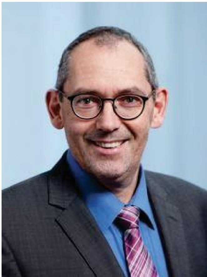
Рис. 2. Доктор Рафаэл Болл

Можно считать, что 15 лет назад наш доклад положил начало исследованиям по библиометрии в ГПНТБ России. Доктор Р. Болл 1 предложил укреплять сотрудничество наших библиотек. Элементом этого сотрудничества стал представленный далее его обзорный доклад, приуроченный к конференции «Либком–2018» (26–30 нояб. 2018 г., г. Суздаль); наименование доклада вынесено в название этой публикации.